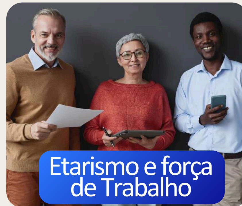
Etarismo e força de Trabalho